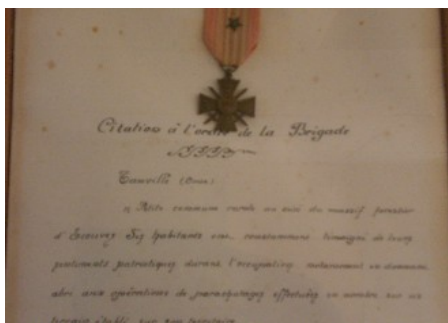
Citation à l'ordre de la brigade avec croix de guerre et étoile de bronze.